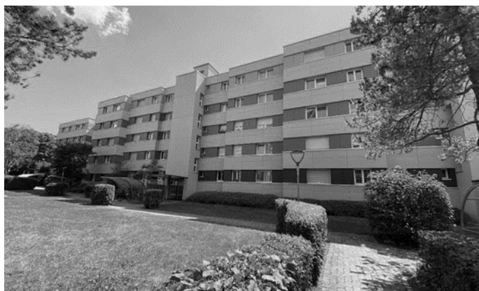
Wohnliegenschaft Froschweg/Gaselstrasse, Schliern bei Köniz (BE)

Allokationen erfolgen in Bestandsliegenschaften mit nachhaltigen Ertragsperspektiven sowie in Bestandsliegenschaften mit Entwicklungspotenzial (Modernisierung, Verdichtung, Umnutzung). Zusätzlich beinhaltet das Portfolio Investitionen in Neubau- und Entwicklungsprojekte.