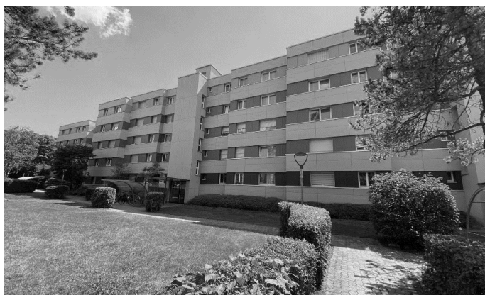
Immeuble résidentiel Froschweg/Gaselstrasse, Schliern bei Köniz (BE)

Les placements sont effectués dans des immeubles existants présentant des perspectives de rendement durable ou un potentiel de développement (modernisation, densification, changement d'affectation). Le portefeuille est également constitué de placements effectués dans des projets de construction et de développement.